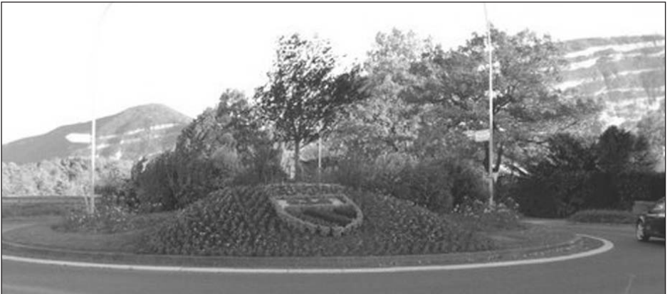
Giratoire route de Veyrier, ch de Place-Verte

Création d'un giratoire à l'intersection du chemin de Place-Verte et la route Antoine-Martin, direction route de Marsillon.