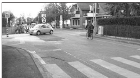
Nouveau passage piéton au no 30, ch de Place-verte, à Vessy.

Concernant le carrefour de la poste : Installation de feux sur le chemin de Place-Verte, avec « bouton