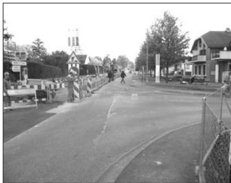
Travaux de mise en séparatif des collecteurs unitaire au carrefour de la poste.

Ce collecteur sera incorporé au réseau secondaire et bénéficiera de la subvention cantonale ordinaire de 22 %.